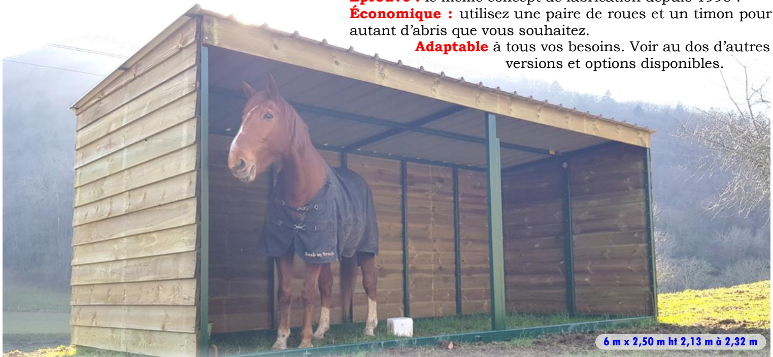
6 m x 2,50 m ht 2,13 m à 2,32 m

Venez voir les vidéos des abris sur notre site !