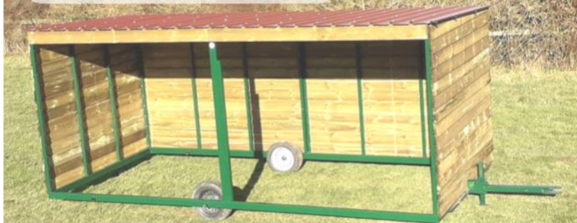
6 m x 3 m ht 2,31 m à 2,50 m