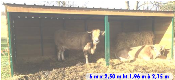
6 m x 2,50 m ht 1,96 m à 2,15 m

Adaptable à tous vos besoins. Voir au dos d'autres versions et options disponibles.