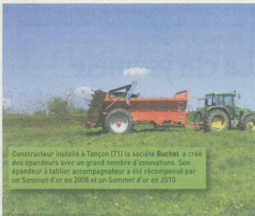
Constructeur installé à Tançon (71) la société Buchet a créé des épandeurs avec un grand nombre d'innovations. Son épandeur à tablier accompagnateur a été récompensé par un Sommet d'or en 2008 et un Sommet d'or en 2010