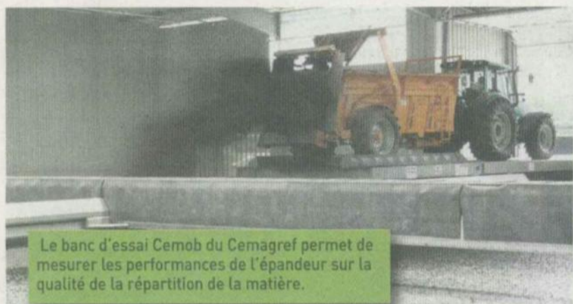
Le banc d'essai Cemob du Cemagref permet de mesurer les performances de l'épandeur sur la qualité de la répartition de la matière.

RECHERCHE / Grâce à son banc d'essai spécifique, la station du Cemagref de Montoldre (03) étudie la qualité de la répartition de la matière organique solide (fumiers, compost) assurée par différents types d'épandeurs. Des mesures utiles pour aller plus loin dans la conception de matériels toujours plus adaptés et performants.