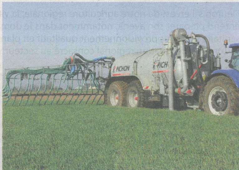
Épandeur de matière liquide Pichon, certifié éco-épandage.

en matière d'environnement ainsi que pour la bonne utilisation du matériel en lien avec les conditions agronomiques. De son côté, le constructeur de Saône-et-Loire, Buchet, propose un épandeur doté de deux hérissons avec tablier accompagnateur. Cela permet un épandage précis, large et régulier du début à la fin, que le tracteur soit en montée ou en descente. Doté d'un DPA, l'épandeur permet de définir tous les paramètres de l'épandage. Le boîtier calculateur automatise l'épandage. Pour identifier le matériel certifié, un logo "éco-épandage" est visible sur les matériels répondant aux exigences du référentiel de certification des performances des matériels d'épandage de produits organiques liquides et solides. L'obtention de la certification et du droit d'apposer le logo éco-